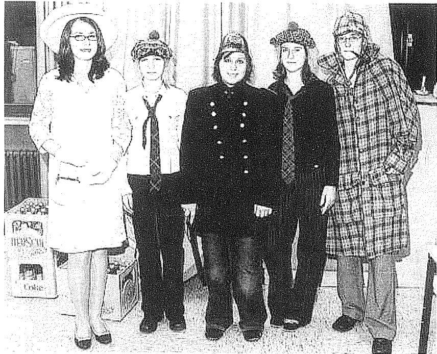
Berühmte englische Persönlichkeiten waren im Pfinzing-Gymnasium zu Gast.